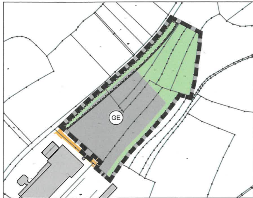
Änderungsplan M 1:5.000