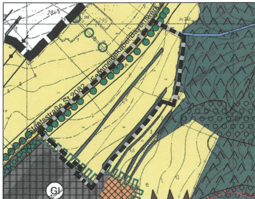
bestehender Flächennutzungsplan (ohne 4. Änderung) mit Änderungsbereich M 1:5.000